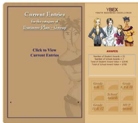
Page du site Internet YBEX Page from YBEX Internet site

À la fin de la compétition, le nom des gagnants est annoncé et affiché sur la page d'accueil du site. Par la suite, la SADC Northwest visite les gagnants afin de leur remettre leur prix. Depuis la création de YBEX, 36 525 $ en prix ont été attribués.