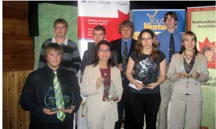
Des participants à Jeunes entrepreneurs Youth Ventures participants

At the end of the competition, the winners are announced and posted on the site's home page. Subsequently, the Northwest CFDC pays a visit to the winners to present their award. Since YBEX was founded, $36,525 in prizes has been awarded.