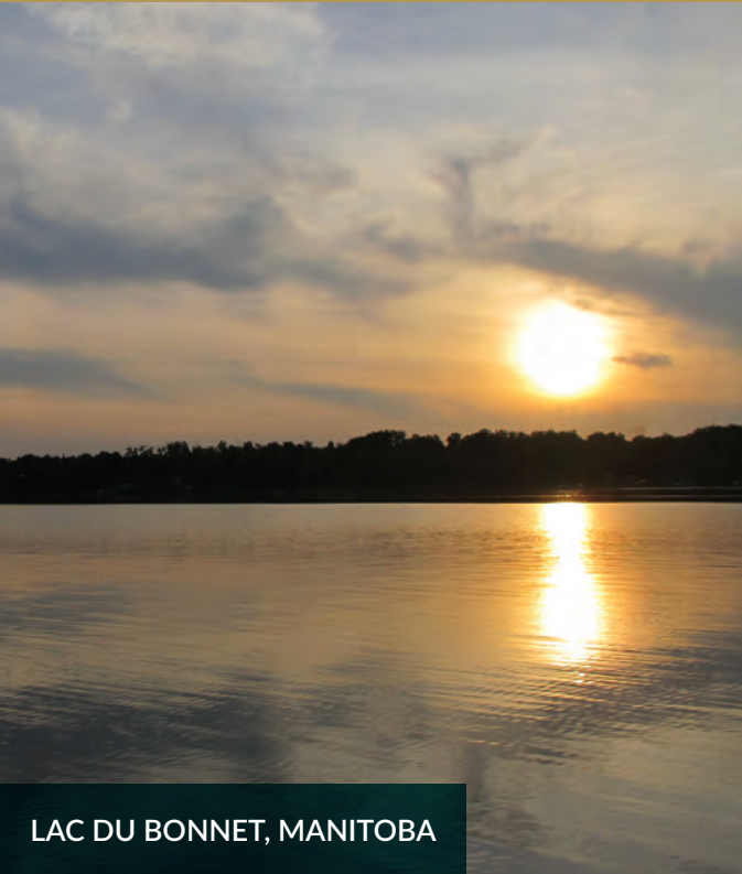
LAC DU BONNET, MANITOBA