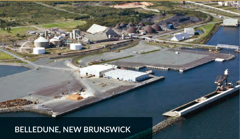
BELLEDUNE, NEW BRUNSWICK