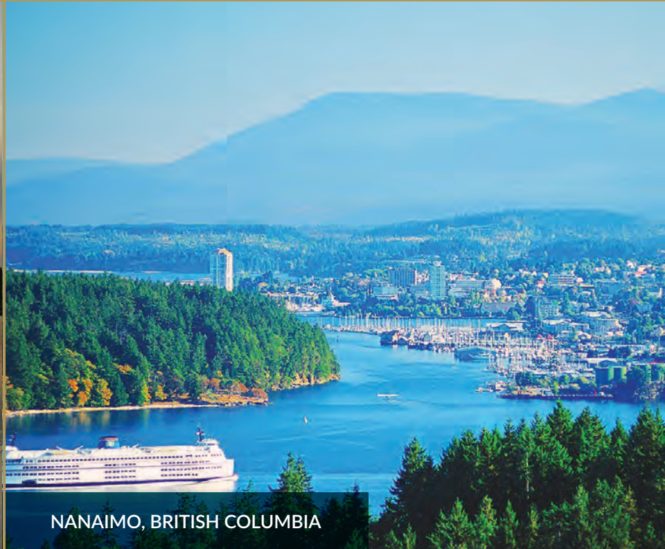
NANAIMO, BRITISH COLUMBIA