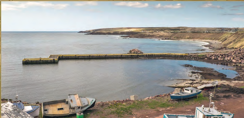
POINT LANCE, NEWFOUNDLAND