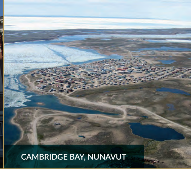
CAMBRIDGE BAY, NUNAVUT