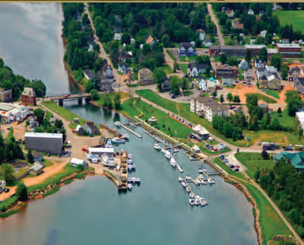
MONTAGUE, PRINCE EDWARD ISLAND