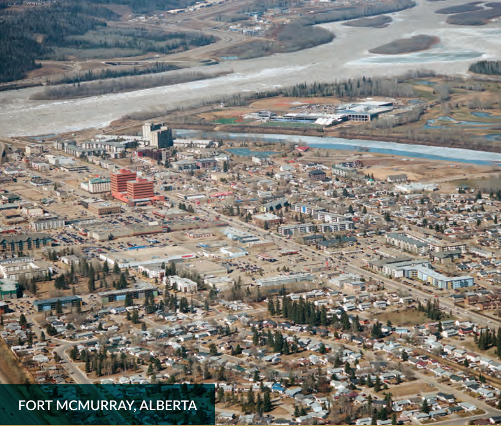
FORT MCMURRAY, ALBERTA